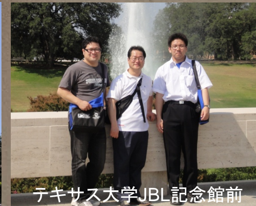
テキサス大学JBL記念館前